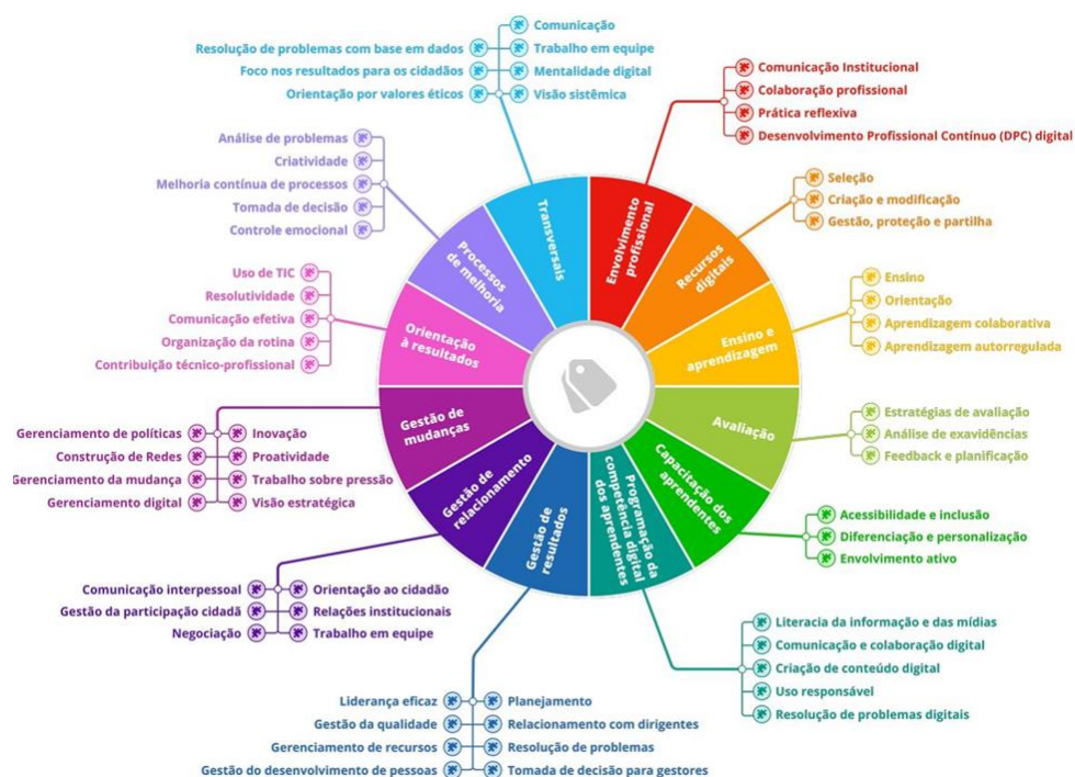
Figura 3 - Mandala de competências

problemas e de situações cotidianas dentro do cenário educacional (PLAFOREDU.MEC, s/d). A equipe de pesquisadores da PlaforEDU organizou as competências em uma estrutura na forma de uma mandala (vide Figura 3).