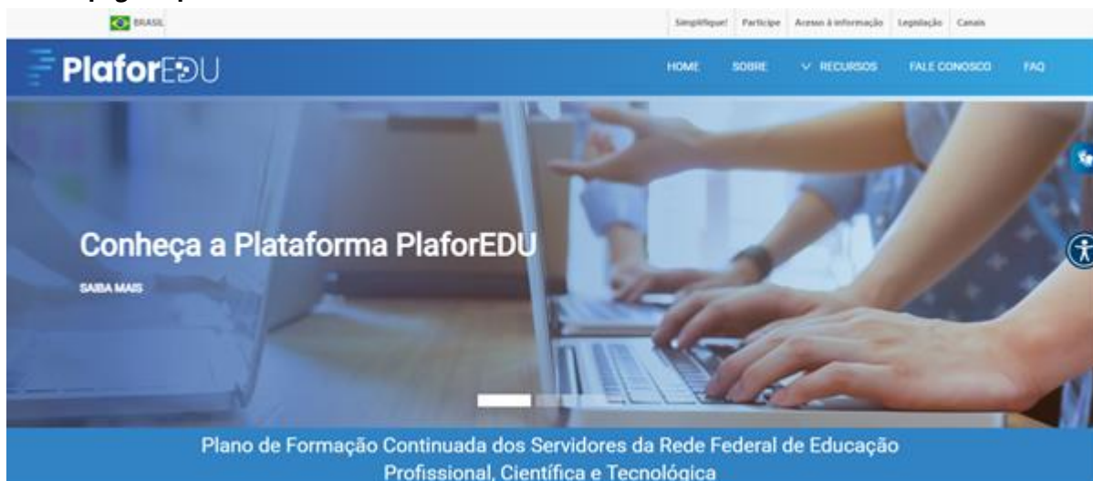
Figura 5 - Homepage da plataforma PlaforEDU

relacionados demonstraram interesse crescente de que outros cursos em fase de finalização além daqueles já ofertados em anos anteriores possam fazer parte dos itinerários formativos na PlaforEDU.