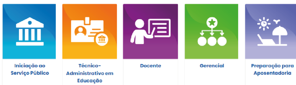
Figura 2 - Itinerários formativos

A plataforma, em conformidade à Figura 2, apresenta cinco itinerários formativos que correspondem aos seguintes perfis de servidores: Iniciação ao serviço público; Técnico administrativo em educação; Docente; Gerencial e Preparação para aposentadoria.