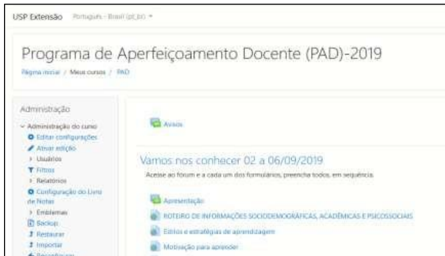
Figura 1 – Página inicial do AVA que abrigou o PAD.