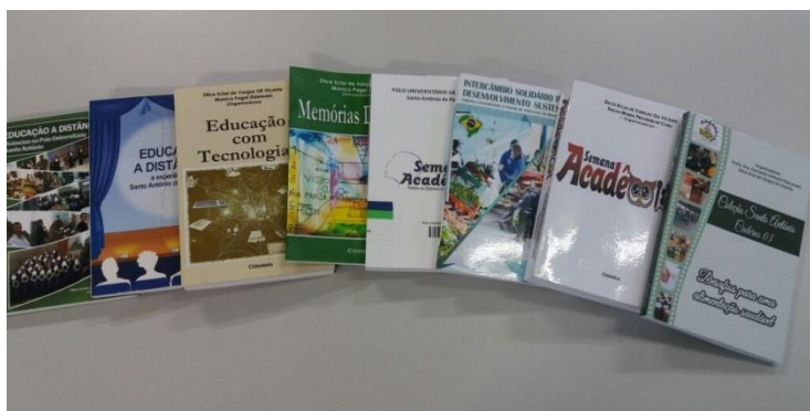
Figura 1 – Publicações produzidas pelo Polo Universitário Santo Antônio.

Todas as construções em termos de formação inicial e continuada, bem como a produção acadêmica decorrente destas formações, têm sido registradas em publicações protagonizadas pelo polo como compromisso em dar visibilidade aos autores que o constituem, cujo conjunto de obras está representado na Figura 1.